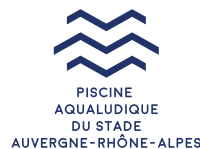
Illustration : Laurent Duffrenoy