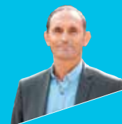
Philippe Gamen, Président de Grand Chambéry

Grand Chambéry a voté lors des conseils du 15 avril et du 3 juin un budget de crise à l'attention de partenaires à hauteur de 4,6 M€ pour le budget général et 3,1 M€ pour le budget annexe dédié Transport. Une aide financière de 296 000 € a notamment été délibérée à destination du délégataire qui gère le Parc des Expositions. Une enveloppe de 110 000 € a également été attribuée aux acteurs sportifs concourant au rayonnement de l'agglomération. Le secteur du tourisme reste très marqué par la crise et des moyens sont déployés afin d'aider des institutionnels tels Grand Chambéry Alpes Tourisme (235 000 €) qui assure la promotion touristique sur le territoire ou SMSB ( Syndicat mixte des stations des Bauges) avec une avance forfaitaire d'1 million d'euros votée afin d'accompagner la gestion des stations Féclaz/Revard et Aillons/Margeriaz dans cette période inédite. Le réseau de transport en commun SYNCHRO, comptabilisé dans un budget annexe dédié, dont la gestion est confiée au délégataire KEOLIS jusqu'en 2024, est très impacté par la crise avec la baisse de fréquentation qui a généré des pertes tarifaires (-2 millions d'euros, -40% par rapport aux prévisions initiales) et contributives (- 900 000 € pour le Versement Mobilité). L'enveloppe dédiée votée va permettre de maintenir l'offre de service initiale et intégrale, ce qui constitue une performance significative au regard des pertes estimées.