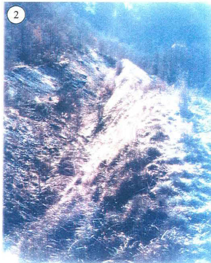
Tourne partie aval, vue du nord.

Tourne para-blocs de Verel Secteur du bois de la Rochelle Construction : 1993 Photographies : état en décembre 2000