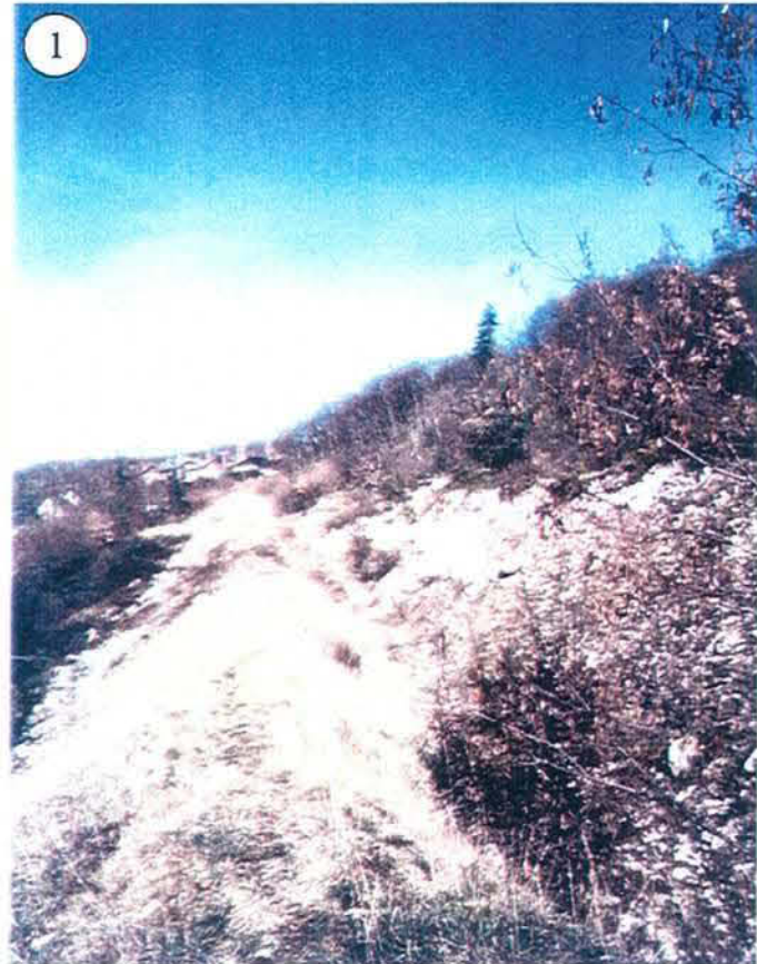
Tourne partie amont, vue du sud.