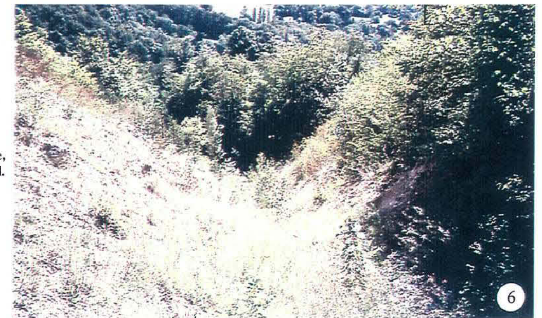
Tourne partie médiane, vue du nord.

Tourne para-blocs de Montbasin Construction : 1974 Photographies : état en août 2000