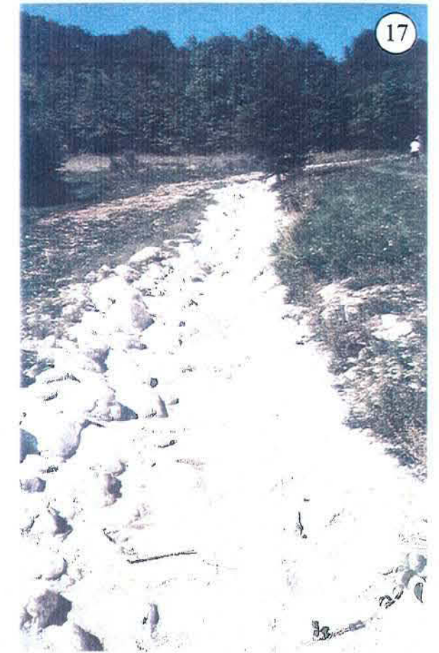
Enrochement du lit à proximité des captages d'eau potable et aperçu du passage busé ramenant les eaux dans le cours naturel.