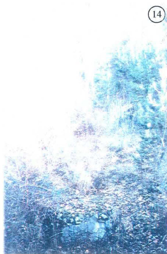
Photo n° 14 : tourne para-blocs des Chavannes (commune de St Alban), état en décembre 2000.