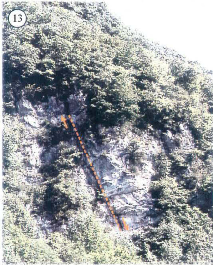
Photo n° 13 : faille oblique sur le rocher des Chavannes, recoupant perpendiculairement les strates calcaires.