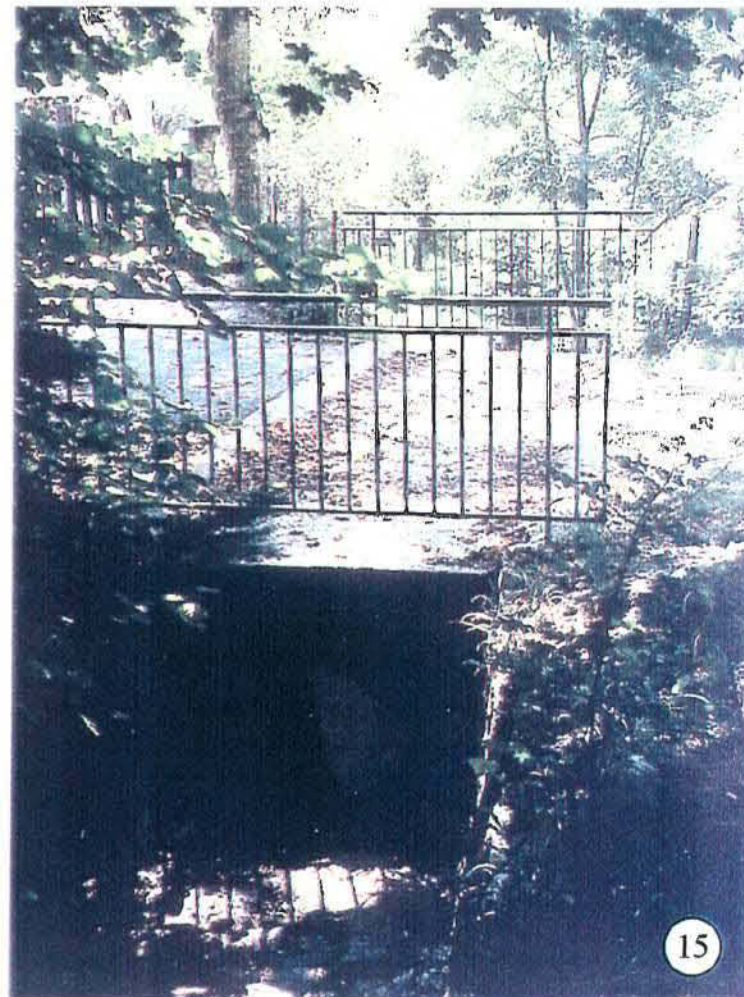
Pragondran, chemin menant au Léchères : nouveau passage d'eau à section rectangulaire, construit suite aux fortes crues du 11 juillet 1995.