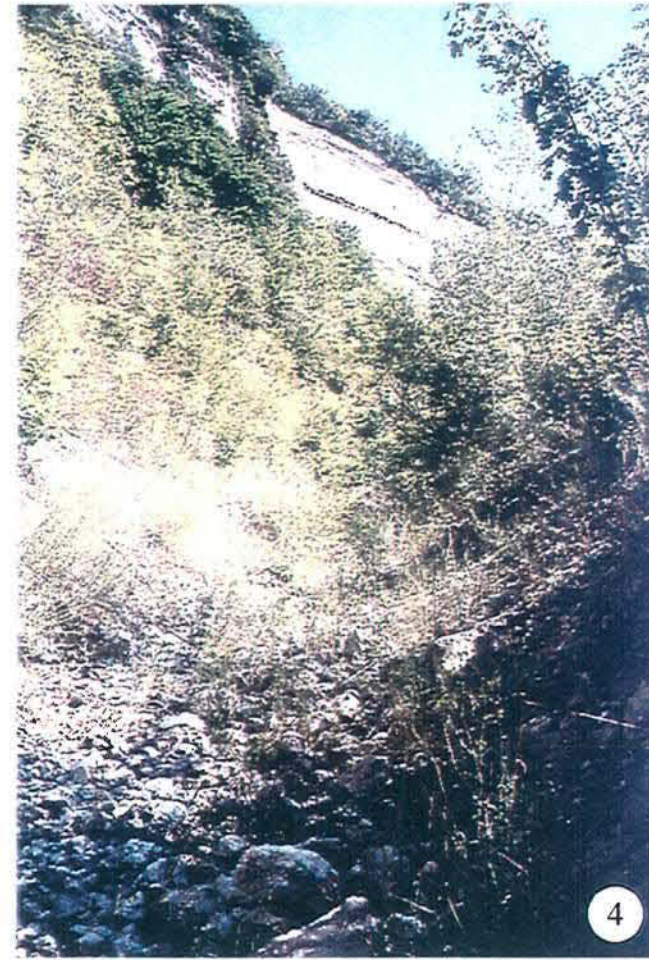
Tourne partie amont, vers le CD 8

Tourne para-blocs de Verel Secteur du bois de la Rochelle Construction : 1993 Photographies : état en décembre 2000