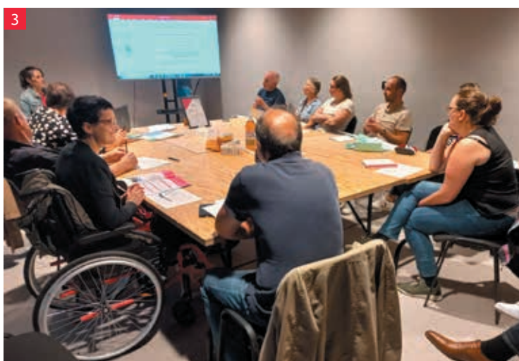
1 et 3 : Évaluation annuelle du PCAET.