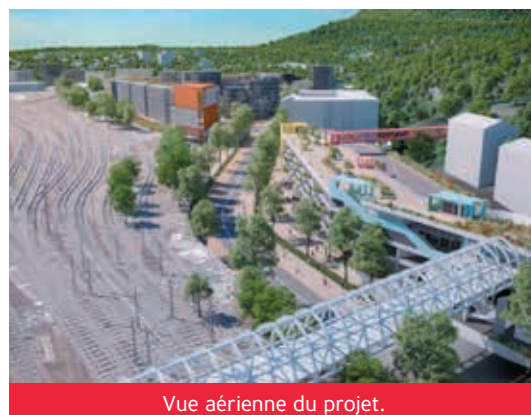
Vue aérienne du projet.