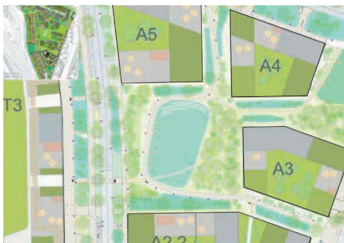
Plan du quartier : support de travail pour les ateliers.