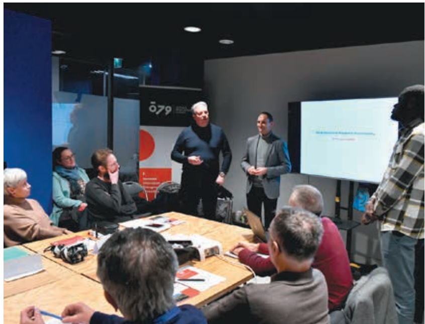
Accueil des nouveaux membres en décembre 2023.

Le Conseil de développement ne doit en aucune manière constituer une tribune politique pour ses membres.