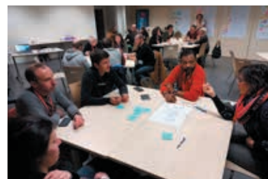
Atelier de travail autour du PLPDMA avec les membres du conseil de développement et d'autres habitants du territoire.

définir les actions de réduction de déchets qui seront déployées sur le territoire de Grand Chambéry pour les six années à venir. Le but de ces ateliers est de permettre une émulation d'idées afin de faire ressortir des propositions d'actions concrètes applicables sur notre territoire.