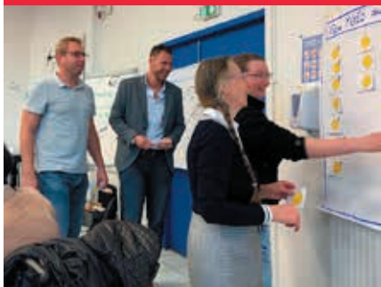
Déroulement des ateliers.