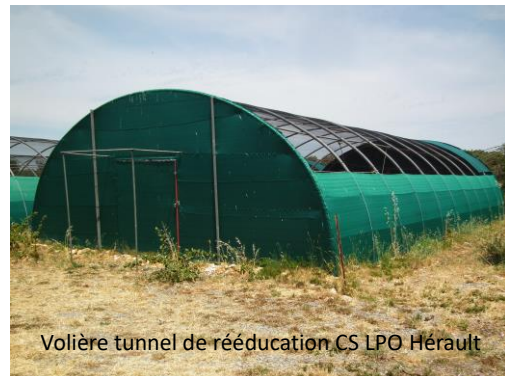
Volière tunnel de rééducation, CS LPO Hérault