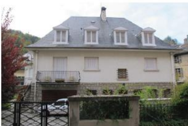
Périmètre de l'étude patrimoniale