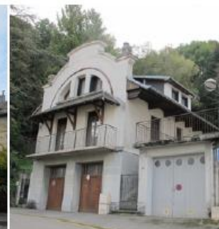
Médecine du travail