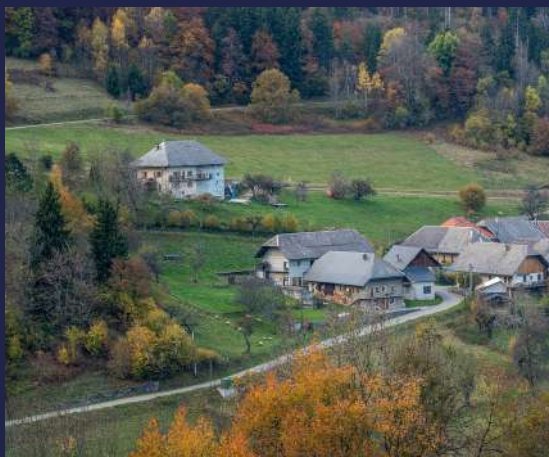
Paysage des Bauges

L'envoi d'une telle demande ne préjuge en rien sa prise en compte.