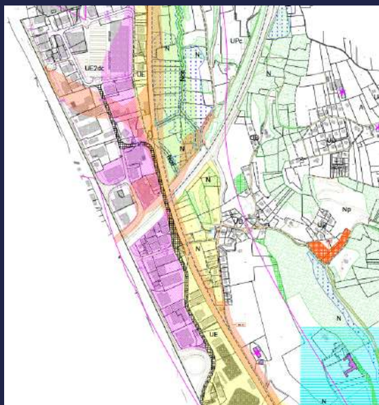
Extrait PLU de Chambery