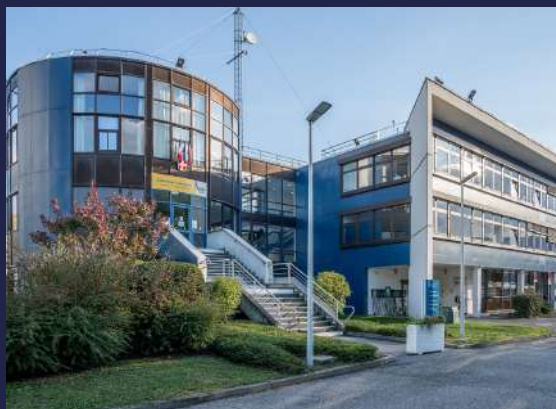
Le siège de Chambery métropole - Cœur des Bauges - Didier Gourbin - Chambery métropole-Coeur des Bauges