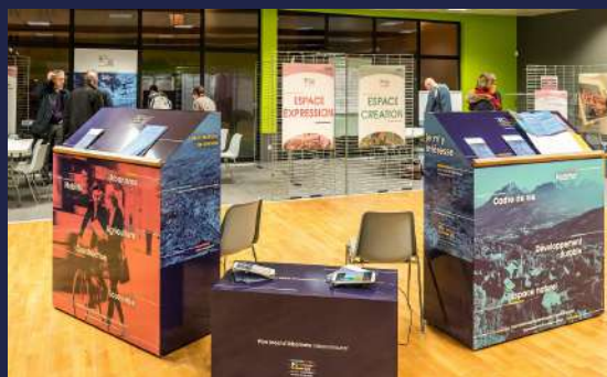
Atelier citoyen PLUi HD février 2017

Un exemplaire papier de l'ensemble de ces documents sera également disponible au siège de Chambéry métropole-Cœur des Bauges -106 allées des Blachères 73026 Chambéry cedex ainsi qu'à l'annexe de l'agglomération dans les Bauges - Avenue Denis Therme 73630 Le Châtelard.