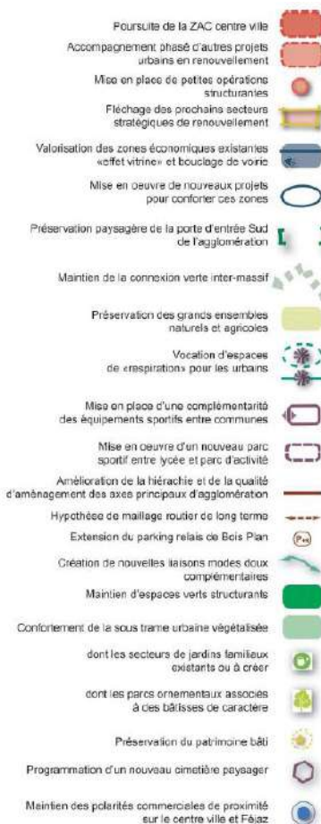
Exemple carte globale du projet d'aménagement et de développement durables PLU la Ravoire