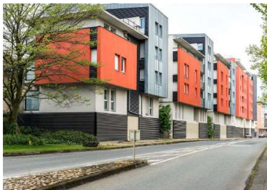
Inauguration de la résidence : les quais du Faubourg

Le PLUi HD, tenant lieu de Programme Local de l'Habitat, fera l'objet d'une évaluation obligatoire tous les 6 ans. Cette évaluation consiste à une analyse des résultats de l'application du PLUi HD au regard des objectifs généraux fixés dans le PADD. L'évaluation donnera lieu à une délibération de Chambéry métropole-Cœur des Bauges, sur l'opportunité de réviser ou non le PLUi HD.