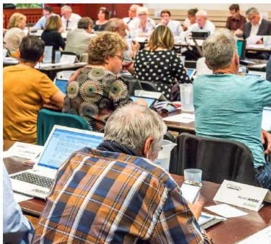
Conseil communautaire de Chambéry métropole/Coeur des Bauges à Savoieexpo

Ce document d'urbanisme unique permettra d'instruire les autorisations d'urbanisme avec des règles cohérentes sur l'ensemble du territoire. Les maires continueront toujours à délivrer les autorisations d'urbanisme.