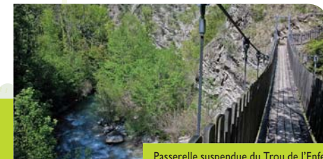
Passerelle suspendue du Trou de l'Enfer

Les vestiges d'anciens moulins le long de la Leysse et de la Ternèze utilisant la force de l'eau nous rappelle que les habitants étaient autrefois beaucoup plus proches des rivières, qui aujourd'hui disparaissent au fond de combes fortement boisées.