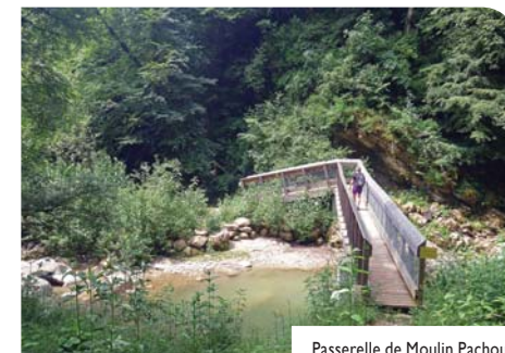
Passerelle de Moulin Pachoud