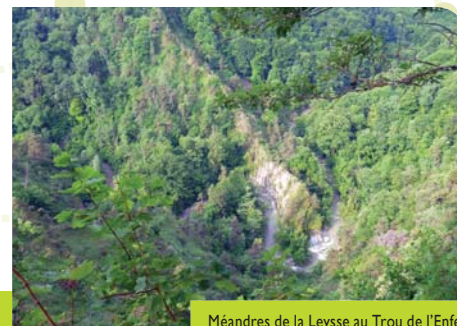
Méandres de la Leysse au Trou de l'Enfer

▶ Le petit hameau de la Crouettaz, à Saint-Jean-d'Arvey abritait un martinet (gros marteau actionné par une roue à aubes) servant à forger le fer pour faire des outils et des clous de charpente.