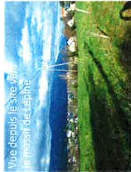
Vue depuis le site vers le massif de l'Espine