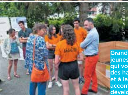
Grand Chambéry fait appel à des jeunes volontaires en service civique qui vont sur le terrain à la rencontre des habitants pour sensibiliser au tri et à la gestion des déchets. Ils accompagnent actuellement le développement du compostage.