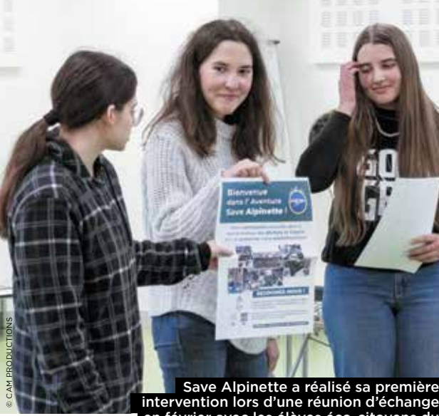
Save Alpinette a réalisé sa première intervention lors d'une réunion d'échange en février avec les élèves éco-citoyens du collège Henry Bordeaux de Cognin.